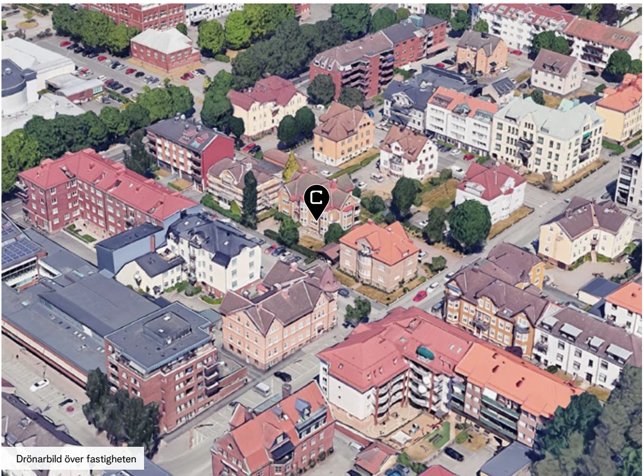
Drönräbild över fastigheten