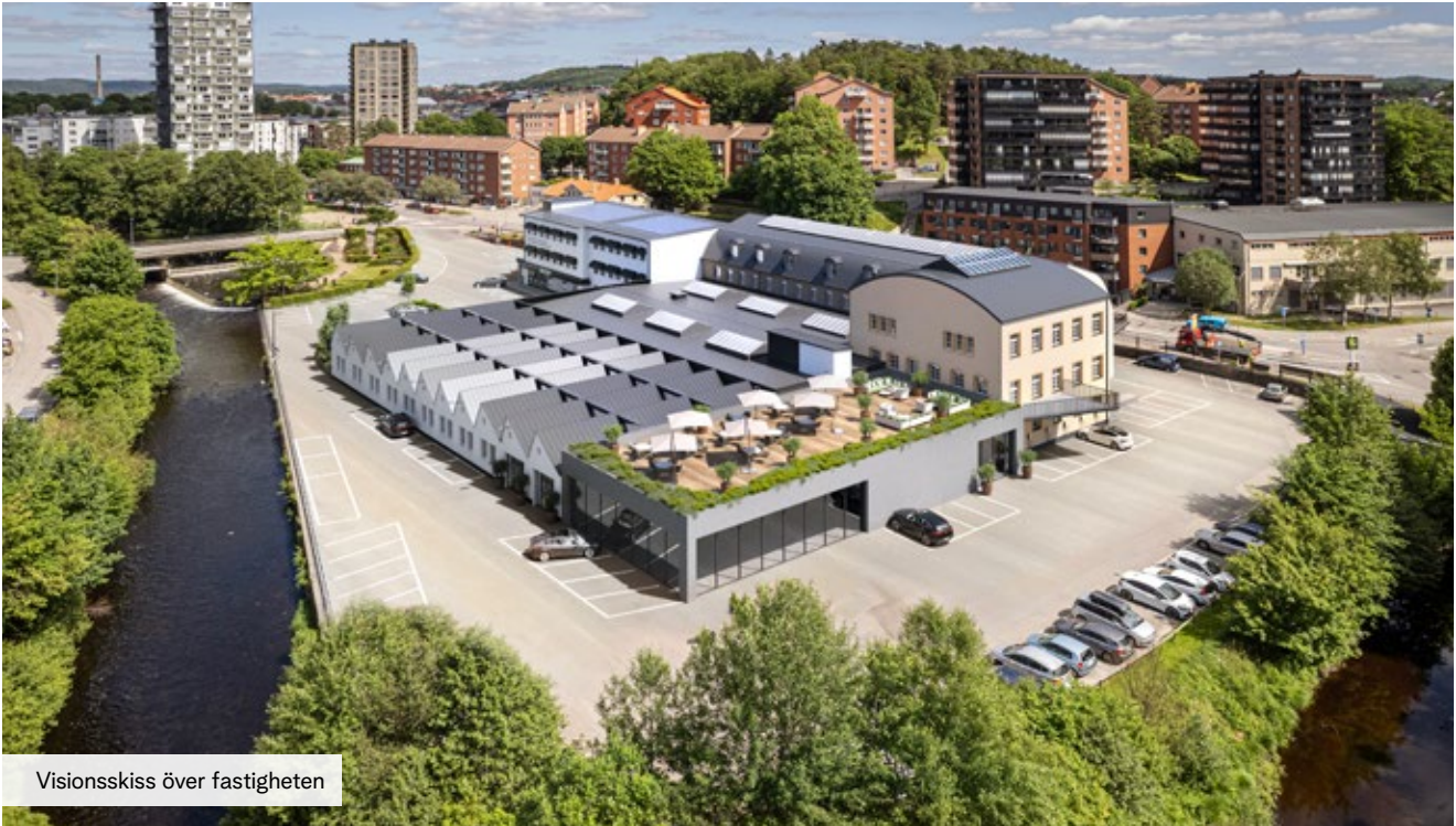
Visionsskiss över fastigheten