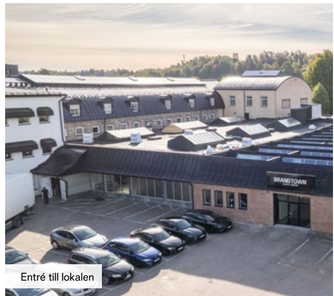
Entré till lokalen