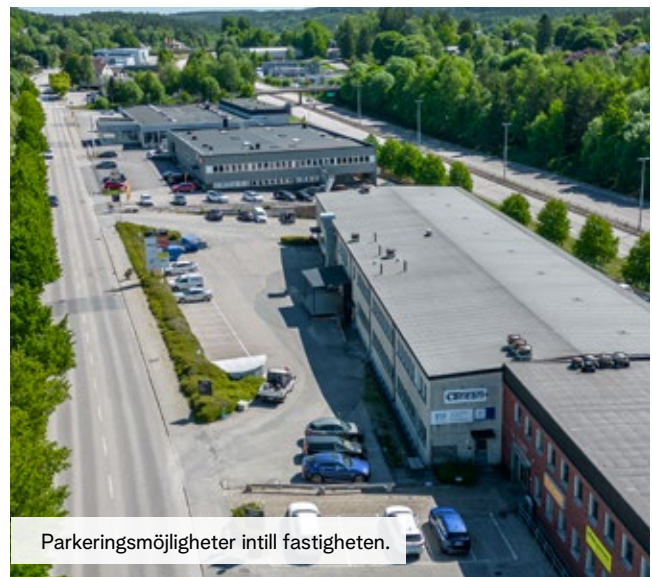
Parkeringsmöjligheter intill fastigheten.