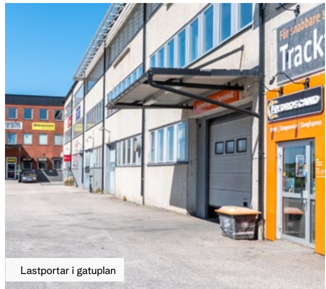
Lastportar i gatuplan