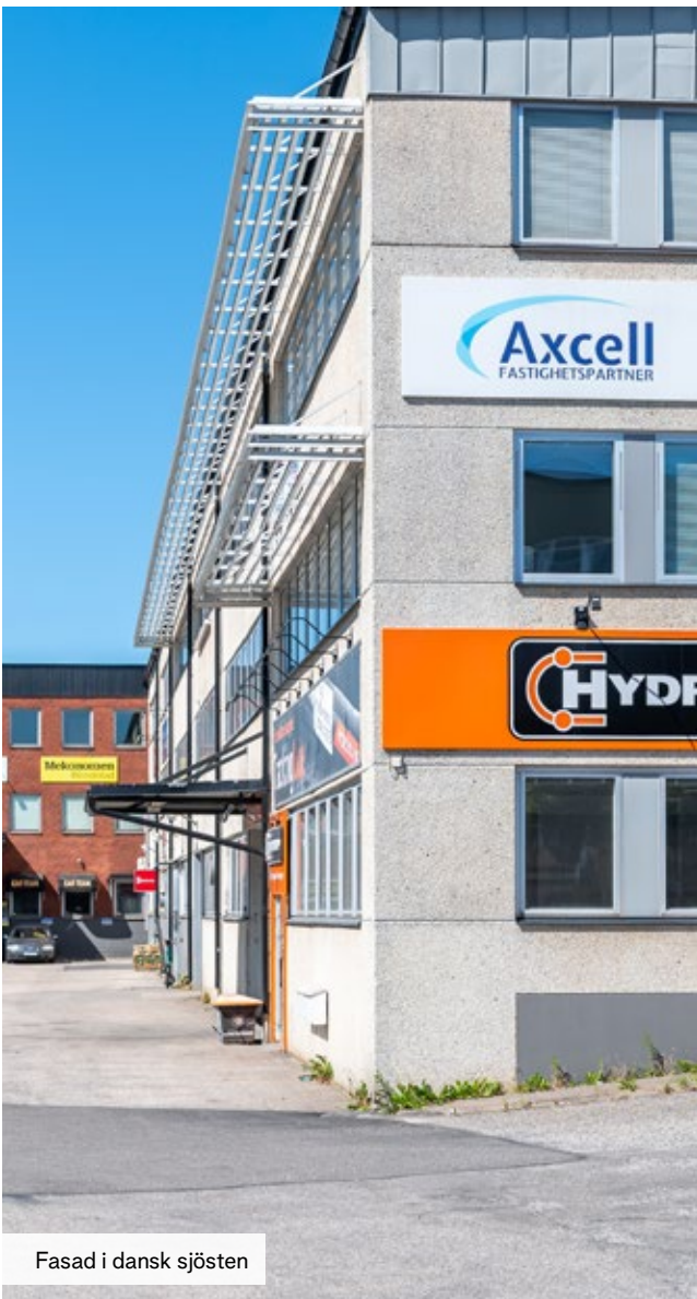
Fasad i dansk sjösten