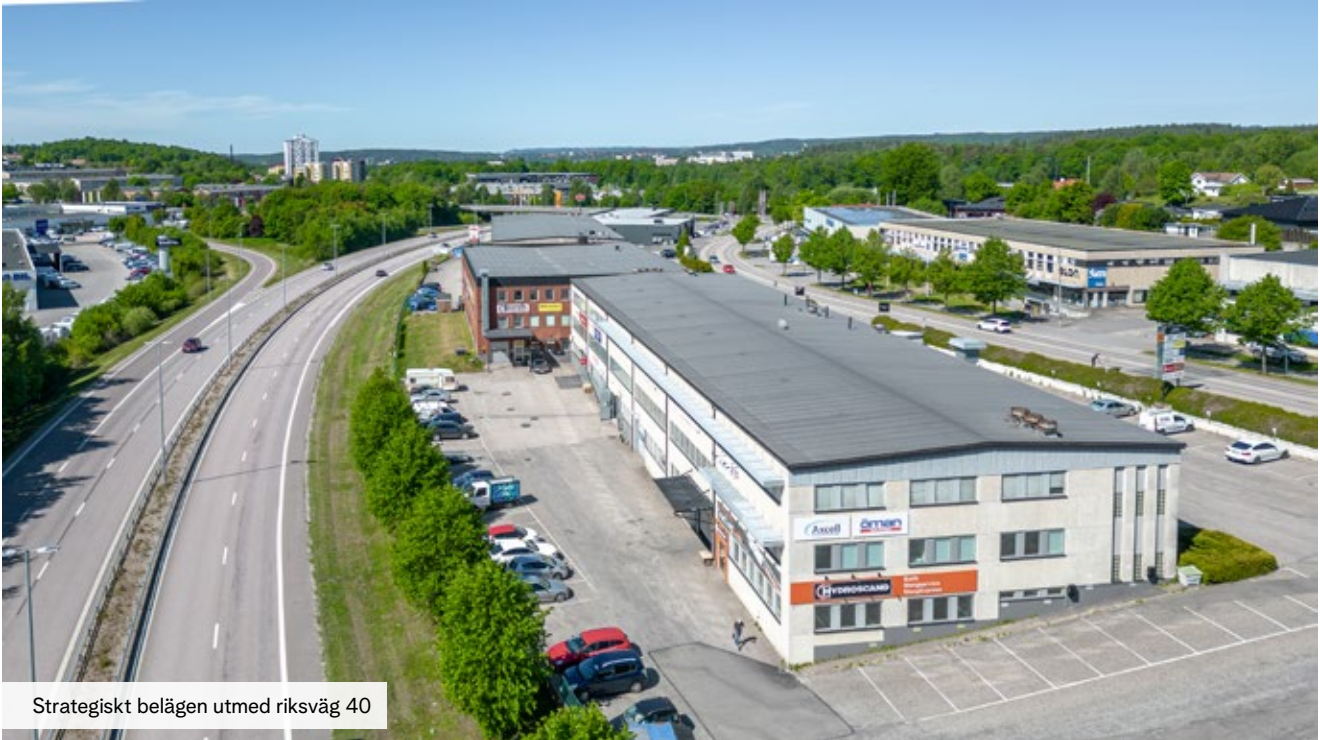
Strategiskt belägen utmed riksväg 40