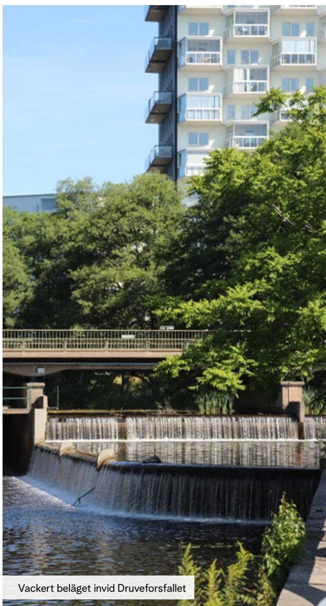
Vackert beläget invid Druveforsfallet