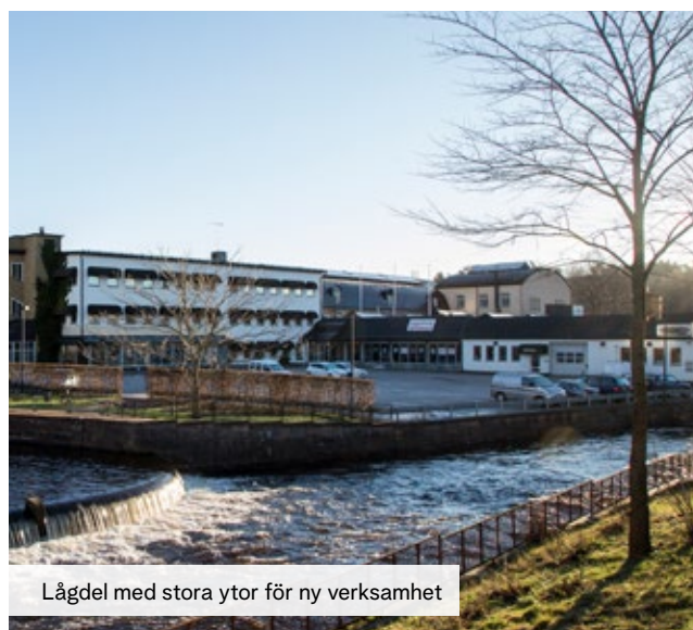
Lågdgel med stora ytor för ny verksamhet