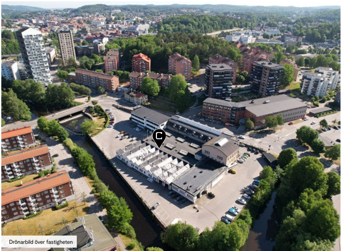
Drönbild över fastigheten