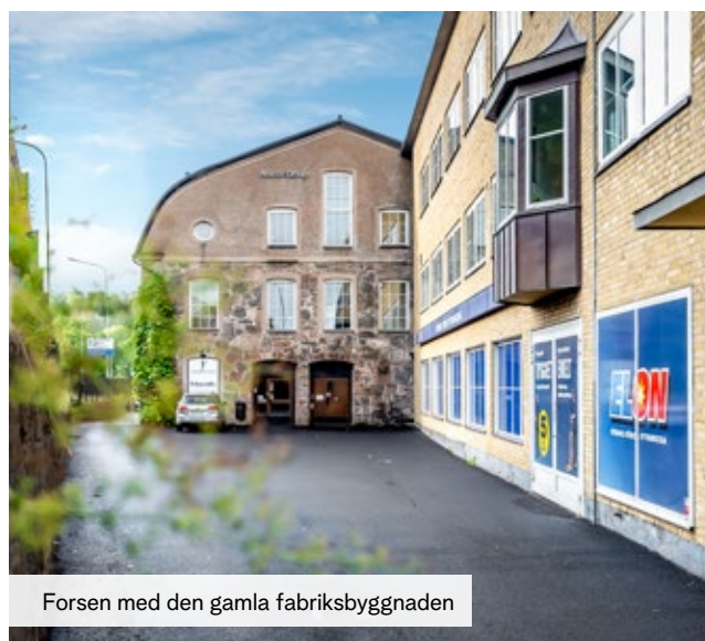
Forsen med den gamla fabriksbyggnaden