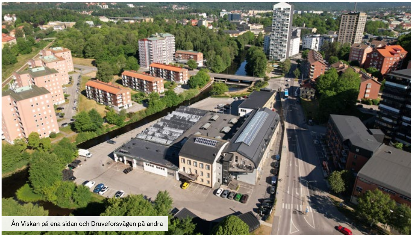
Ån Viskan på ena sidan och Druveforsvägen på andra