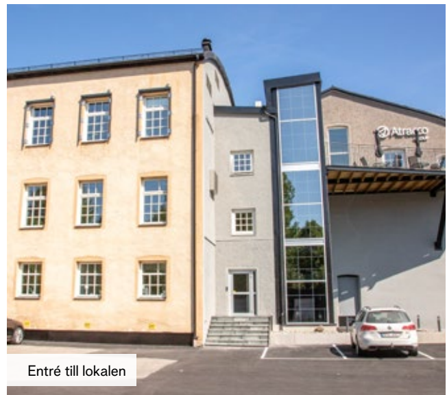
Entré till lokalen