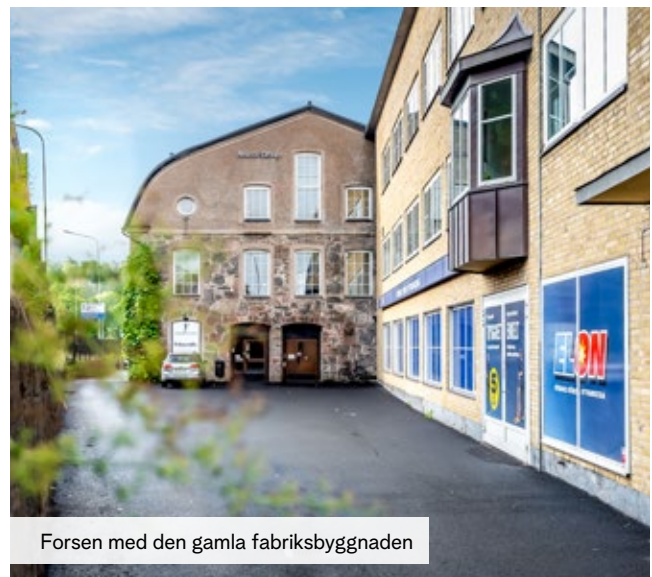
Forsen med den gamla fabriksbyggnaden