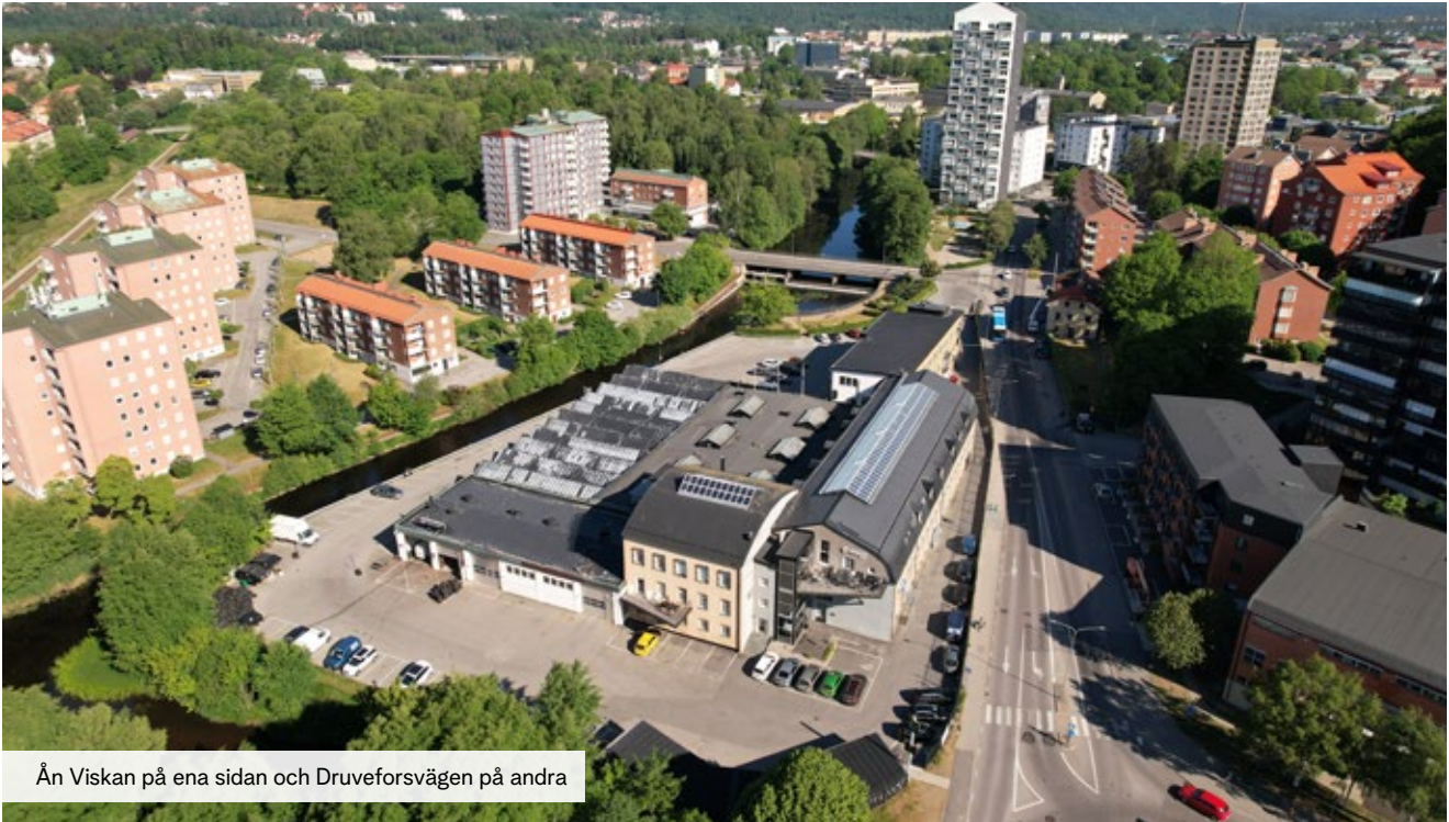
Ån Viskan på ena sidan och Druveforsvägen på andra