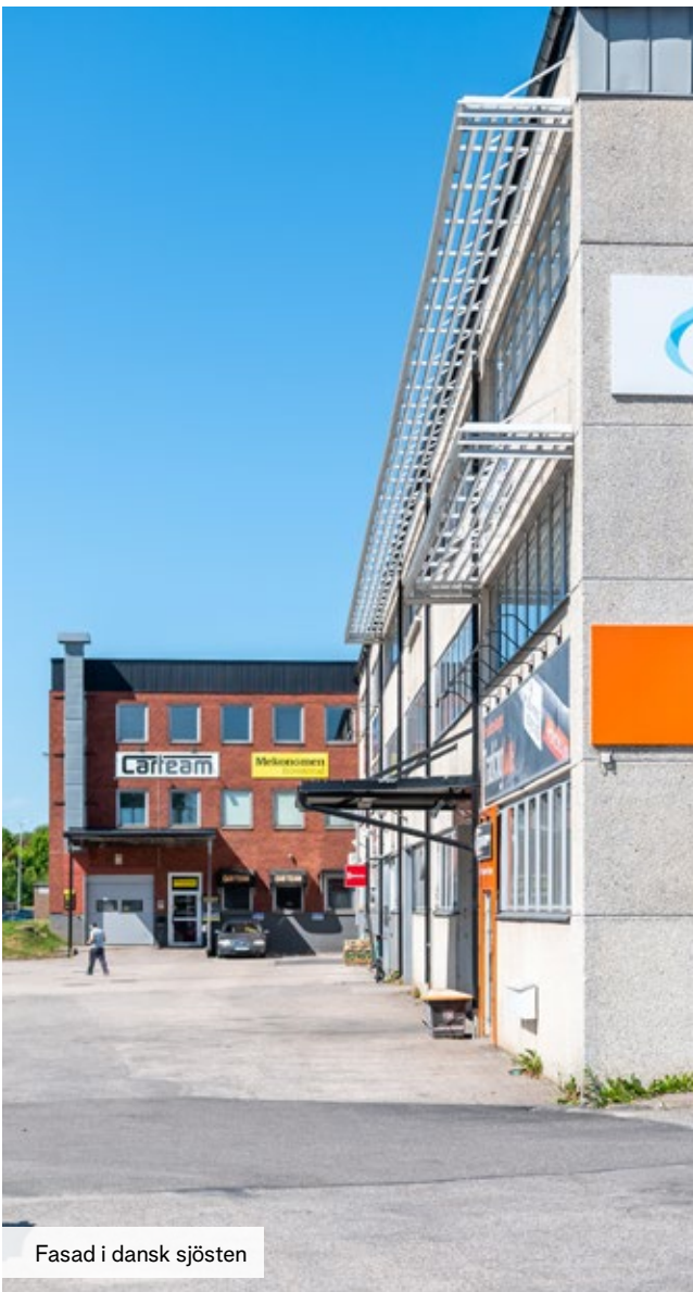
Fasad i dansk sjösten