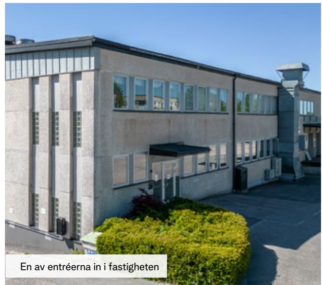
En av entréerna in i fastigheten