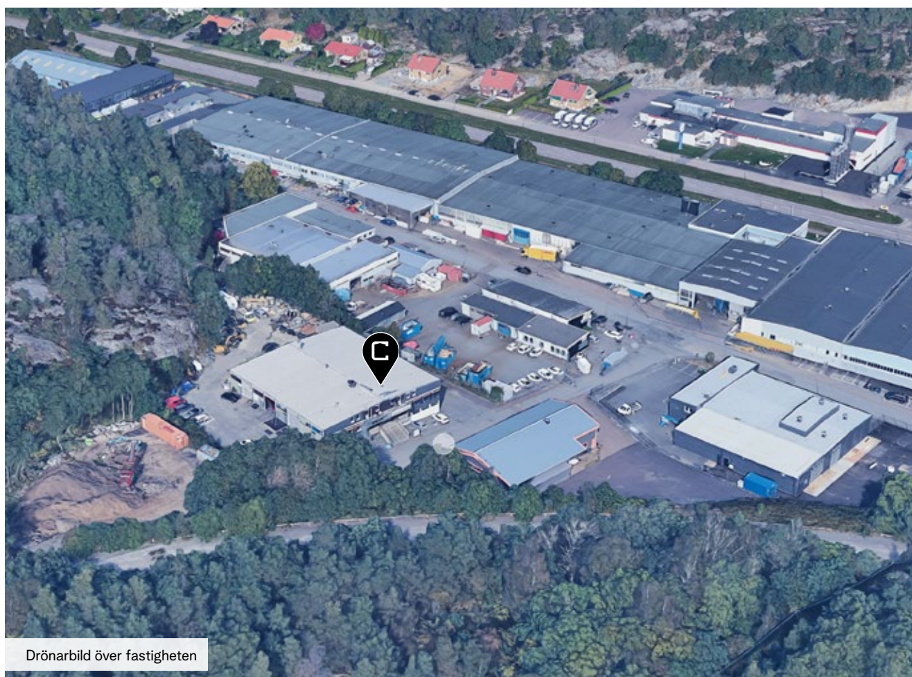
Drönarbild över fastigheten