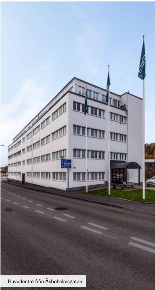
Huvudentré från Åsboholmsgatan