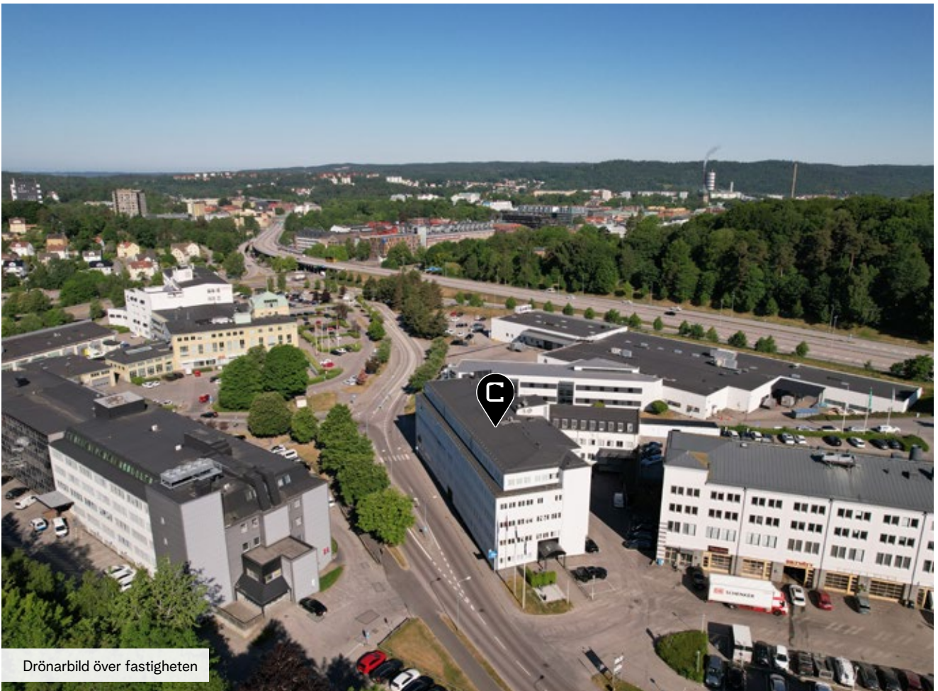
Drönbild över fastigheten