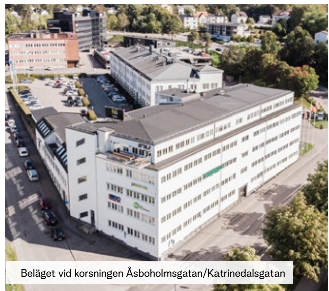
Beläget vid korsningen Åsboholmsgatan/Katrinedalsgatan