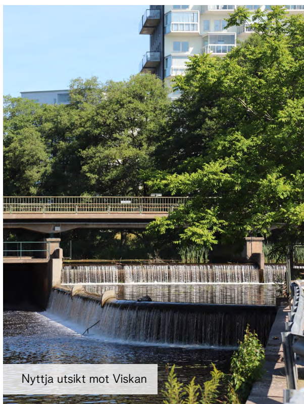
Nyttja utsikt mot Viskan