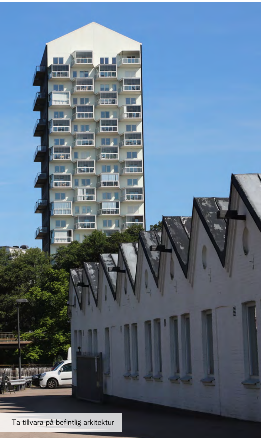
Ta tillvara på befintlig arkitektur