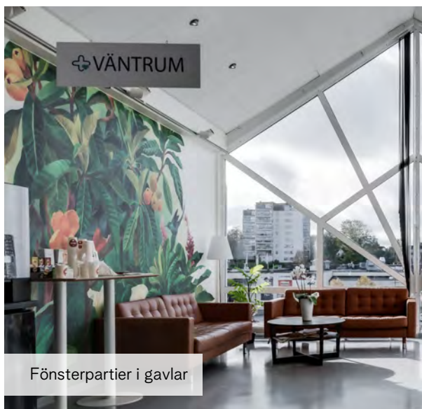
Fönsterpartier i gavlar