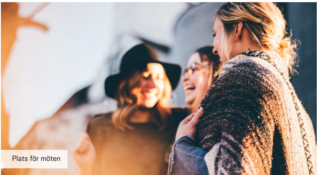
Plats för möten